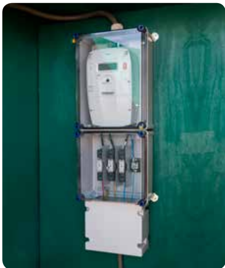
Figuur 1 Minimaal benodigde ruimte voor netbeheerder in bouwkasten.