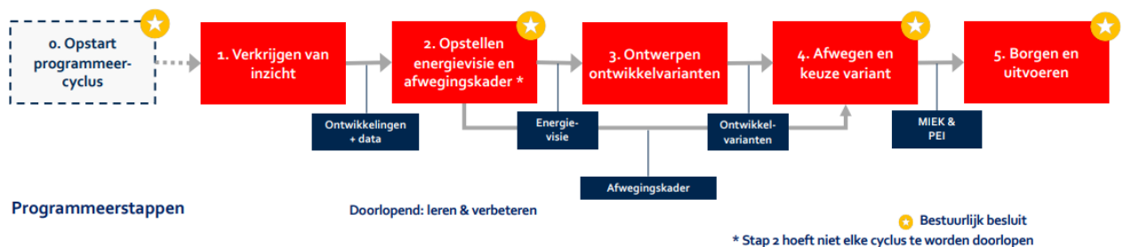
Afbeelding: Schema Integraal Programmeren