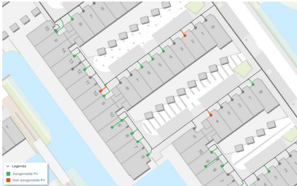
Figuur 1 - Voorbeeld van een wijk waarbij er 4 huishoudens zijn met zonnepanelen die niet zijn aangemeld via energieleveren.nl .